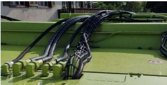
Bild: Öl- und Stromversorgung Fahrzeug der Kehrriechabfuhr

Die ganze Öl- und Stromversorgung für die Presse verläuft über das Fahrzeugdach, da das Heckteil zur Entleerung des Fahrzeuges angehoben werden muss.