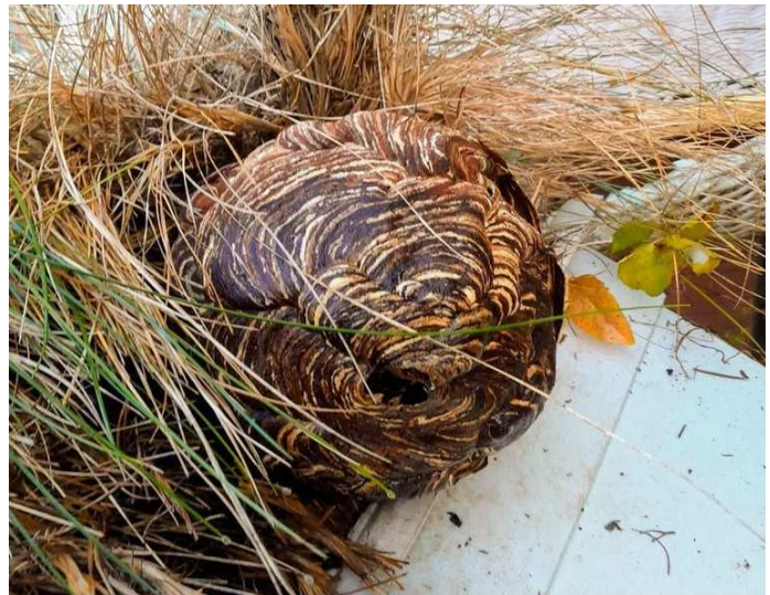
Vornest der Asiatischen Hornisse

Die Vornester der Asiatischen Hornisse befinden sich jeweils in Bodennähe, zum Beispiel an einem grossen Pflanzentopf, und sind etwa faustgross. Die Hauptnester werden im Verlauf der kommenden Wochen gebaut, sind etwa basketballgross und befinden sich oft in hohen Baumkronen.